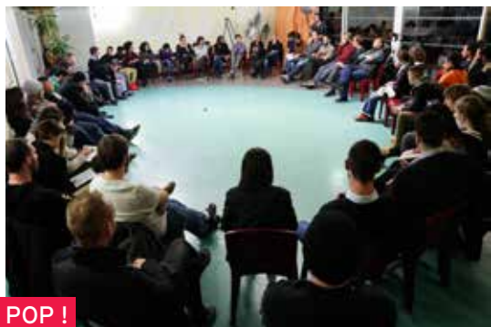
ASSOCIATION 100% ÉDUC POP !

et critique dans la société. Issue de l'Éducation populaire, notre mouvement agit pour que les jeunes soient acteurs de leur développement.